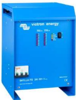
Skylla TG 24 50 3 phase

Para saberlo todo sobre las baterías, las configuraciones posibles y ejemplos de sistemas completos, pida nuestro libro gratuito "Energía Sin Límites" también disponible en www.victronenergy.com