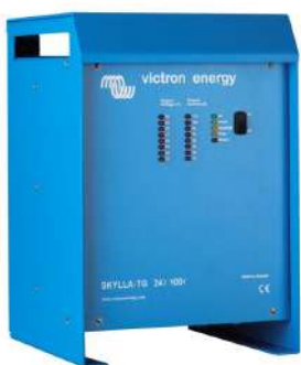
Skylla TG 24 100