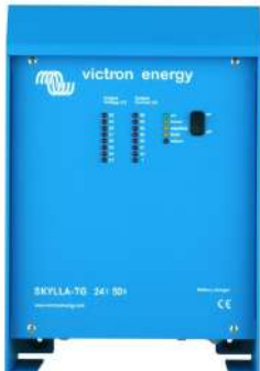
Skylla TG 24 50