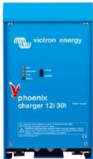
Phoenix charger 12V 30A