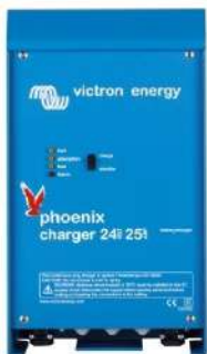
Phoenix charger 24V 25A