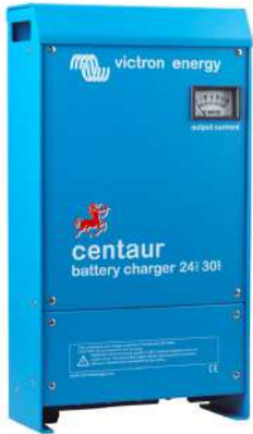
Centaur Battery Charger 24 30