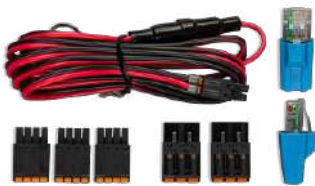
Accesorios incluidos con el Cerbo GX