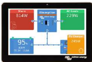
GX Touch 50 (pantalla opcional para Cerbo GX)