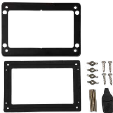
Accesorios incluidos con el GX Touch 50