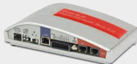
/ Fronius Datamanager Box 2.0