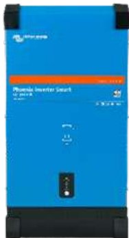
Inversor Phoenix Smart 12/3000