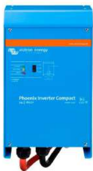
Phoenix Inverter Compact 24/1600

Todos los modelos disponen de un Puerto RS-485. Todo lo que necesita conectar a su PC es nuestro interfaz MK2 (ver el apartado "Accesorios"). Este interfaz se encarga del aislamiento galvánico entre el inversor y el ordenador, y convierte la toma RS-485 en RS-232. También hay disponible un cable de conversión RS-232 en USB. Junto con nuestro software VEConfigure , que puede descargarse gratuitamente desde nuestro sitio Web www.victronenergy.com , se pueden personalizar todos los parámetros de los inversores. Esto incluye la tensión y la frecuencia de salida, los ajustes de sobretensión o subtensión y la programación del relé. Este relé puede, por ejemplo, utilizarse para señalar varias condiciones de alarma distintas, o para arrancar un generador. Los inversores también pueden conectarse a VENet , la nueva red de control de potencia de Victron Energy, o a otros sistemas de seguimiento y control informáticos.