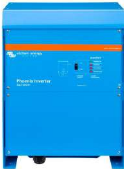
Phoenix Inverter 24/5000