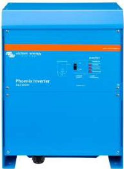
Phoenix Inverter 24/5000