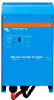
Phoenix Inverter Compact 24/1600

Todos los modelos disponen de un Puerto RS-485. Todo lo que necesita conectar a su PC es nuestro interfaz MK2 (ver el apartado "Accesorios"). Este interfaz se encarga del aislamiento galvánico entre el inversor y el ordenador, y convierte la toma RS-485 en RS-232. También hay disponible un cable de conversión RS-232 en USB. Junto con nuestro software VEConfigure , que puede descargarse gratuitamente desde nuestro sitio Web www.victronenergy.com , se pueden personalizar todos los parámetros de los inversores. Esto incluye la tensión y la frecuencia de salida, los ajustes de sobretensión o subtensión y la programación del relé. Este relé puede, por ejemplo, utilizarse para señalar varias condiciones de alarma distintas, o para arrancar un generador. Los inversores también pueden conectarse a VENet , la nueva red de control de potencia de Victron Energy, o a otros sistemas de seguimiento y control informáticos.