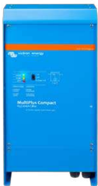
MultiPlus Compact 12/2000/80