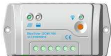
BlueSolar PWM-Pro 10 A