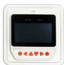
Panel remoto BlueSolar Pro