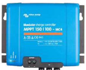
Controlador de carga solar MPPT 150/100-MC4