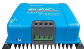
Controlador de carga solar MPPT 150/100-Tr